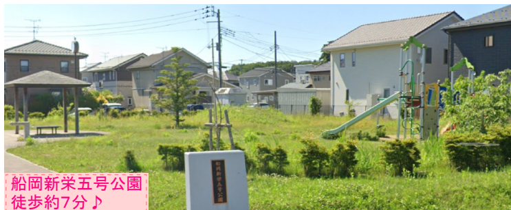
船岡新栄五号公園 徒歩約7分♪

上下水道引込有りの整形地です！ ヨークタウン柴田・フレスコキクチ柴田店まで車で約3分♪ 日々のお買い物にも便利な立地です！ 建築条件無しのため、お好きなハウスメーカー・ 工務店にて建築可能です♪